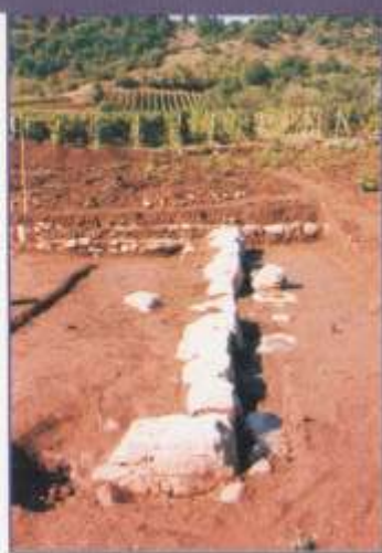
Γόμφοι, Δημόσιο κτίριο