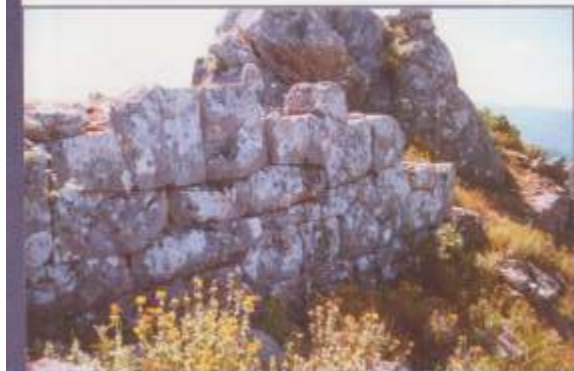
Ελληνόκαστρο. Αρχαίο οικυρά