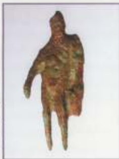
Χάλκινο αγαλματίδιο «Κερβούου Ερμή»