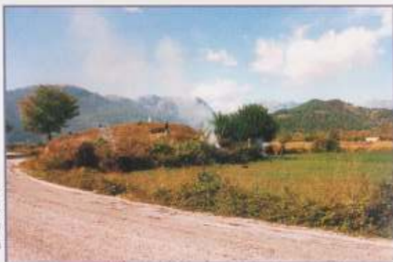
Τοφικός Τυμβός Μαυραμιάτι Γελένθι