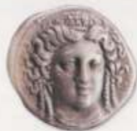
Αργυρό διδραχμον Γόμφων-Φλιππούδαως Θεσσαλίας, π. 350-340 π.Χ.