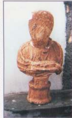
Ημίεργη προτομή αυτοκρατορικών χρόνων

Τμήματα του τείχους και πύργου της αρχαίας πόλης έχουν αποκαλυφθεί στα ΝΔ και ΒΑ υψώματα του αρχαιολογικού χώρου. Το τείχος ακο-