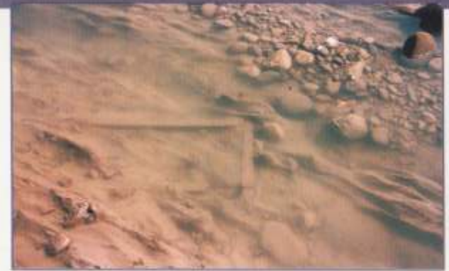
Κοίτη Παμισού. Πάλινη λάρνακα

λουθεί την κορυφογραμμή των λόφων. Μέσα στην αρχαία πόλη, ύστερα από σωστικές ανασκαφές σε αγρούς, έχουν αποκαλυφθεί αρχιτεκτονικά λείψανα μεγάλων δημοσίων κτιρίων. Ενα από αυτά πιθανόν να ανήκει στην αγορά της αρχαίας πόλης. Στον ίδιο χώρο βρέθηκαν μια ημίεργη προτομή αυτοκρατορικών χρόνων, σπόνδυλοι κιόνων και μαρμαρίνη λάρνακα «νεοαττικού» τύπου με παράσταση στην εμπρόσθια πλευρά «αρπαγή Κόρης».