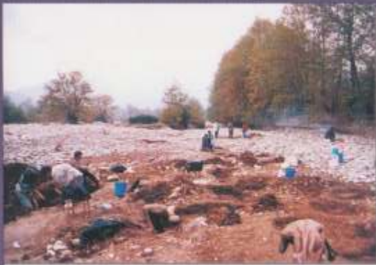
Ανασκαφή στην κοίτη του Πάμισου

Η παλαιότερη οργανωμένη εγκατάσταση ανθρώπων στην περιοχή του Δήμου Μουζακίου βρίσκεται στην κτηματική περιφέρεια Μαυρομματίου. Πρόκειται για προϊστορικούς οικισμούς της νεολιθικής περιόδου γνωστούς ως «Μαγούλα Γιατρού» και «Μαγούλα Κεφαλόβρυσου».