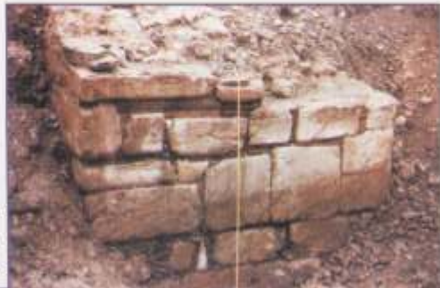
Υστερορωμαϊκό βάθρο γέφυρας

Ο Φίλιππος Β', ο βασιλιάς της Μακεδονίας, με το πρόσχημα της επιθετικότητας των Αθαμάνων εναντίον των Θεσσαλών, ενίσχυσε το κτίσιμο της νέας πόλης με αποίκους και για μικρό χρονικό διάστημα έφερε το όνομα αυτού «Φίλιπποι ή Φιλιππόπολις» και έκοψε νομίσματα με την επιγραφή «Φιλιπποπολιτών». Μετά το 330 π.Χ. η πόλη εμφανίζεται με το παλιό της όνομα Γόμφοι.