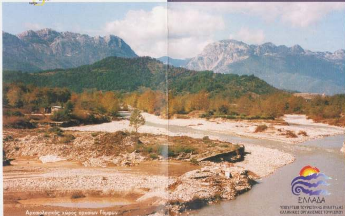
Αρχαιολογικός χώρος αρχαίων Γόμφων

Οι φωτογραφίες των αντικείμενων και των ερειπίων είναι ελεύθερες και επιτρέπεται η χρήση τους σε οποιαδήποτε παραγωγή. Κείμενο: Λαμπρός Π. Χατζηγιάννης, Αρχαιολόγος, Διευθυντής Δ.Δ. ΕΠ.Α.Κ. Τα αρχαία κείμενα είναι Ελληνικά. ΕΚΤΥΠΩΣΗ: Γραφείο Τύπου Δημοκρατίας Θεσσαλονίκης.