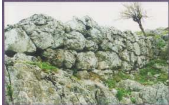
Πορτή Ίταμος Αρχαία αχύρσις