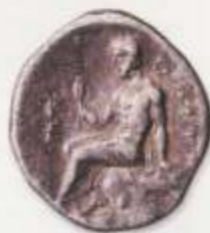
Εμπροσθέντιος: Κεφαλή πριανόν της Ήρας Οπισθόντιος: Ξεῦς καθήμενος αε βράχο

Οι φωτογραφίες των αντικείμενων και των ερειπίων είναι ελεύθερες και επιτρέπεται η χρήση τους σε οποιαδήποτε παραγωγή. Κείμενο: Λαμπρός Π. Χατζηγιάννης, Αρχαιολόγος, Διευθυντής Δ.Δ. ΕΠ.Α.Κ. Τα αρχαία κείμενα είναι Ελληνικά. ΕΚΤΥΠΩΣΗ: Γραφείο Τύπου Δημοκρατίας Θεσσαλονίκης.