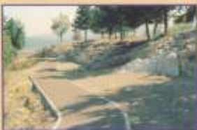
Η βόρεια πλευρά του κάστρου