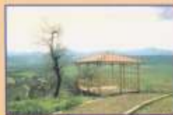
Κιόσκι με ενημερωτικό υλικό νότια του κάστρου