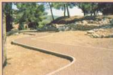
Η ανατολική πλευρά του κάστρου

Το Κάστρο Καλλιθήρων είναι ένας ανοικτός αρχαιολογικός χώρος και μπορεί να τον επισκεφθεί κανείς όλες τις μέρες της εβδομάδας.