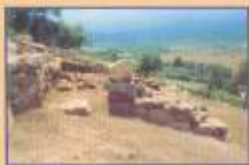
Η δυτική πύλη και μια από τις κλίμακες που οδηγούσε στον περίπατο του τείχους του κάστρου

Σήμερα εξωτερικά του κάστρου έχει διαμορφωθεί η περιοχή με έναν περίπατο που περιτρέχει όλο το μήκος των τειχών του κάστρου.