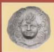
Πήλινο αποτύπωμα με κεφάλι νέου