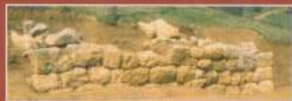
Αρχαίος αναλημματικός τοίχος