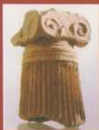
Πηλινός κιονίσκος περιρραντηρίου