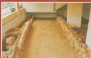
Δυο από τους δρόμους του αρχαίου οικισμού