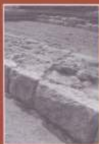
Τμήμα του τείχους